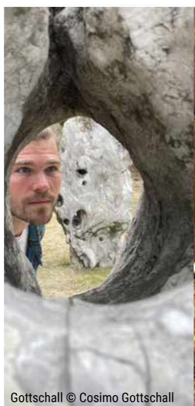
Gottschall © Cosimo Gottschall

【暮らしの保健室】がオープンします!予約なし、無料(寄付金は歓迎)、どなたでもご利用いただけます。相談があってもなくても、お気軽にお越しください。カフェ感覚でお茶を飲みに来て、健康や老後のことなど気になることをお話ししましょう。日本で家庭医として働いてきた医師と、ケルンで長年活躍中の看護師が皆さまをお待ちしています。