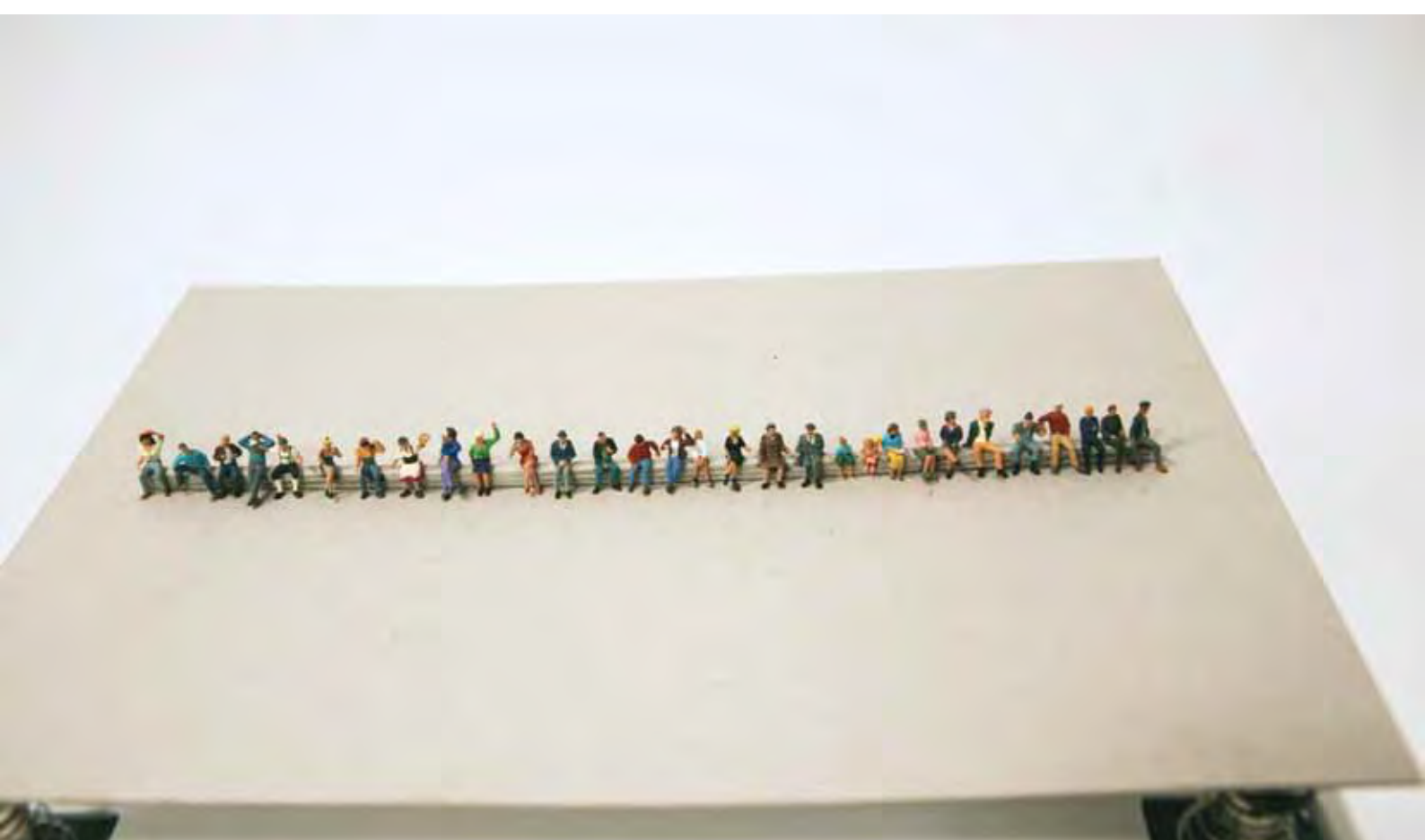
SERIES OF DOMESTIC EARTHQUAKES I / STOCKHOLM / 2010