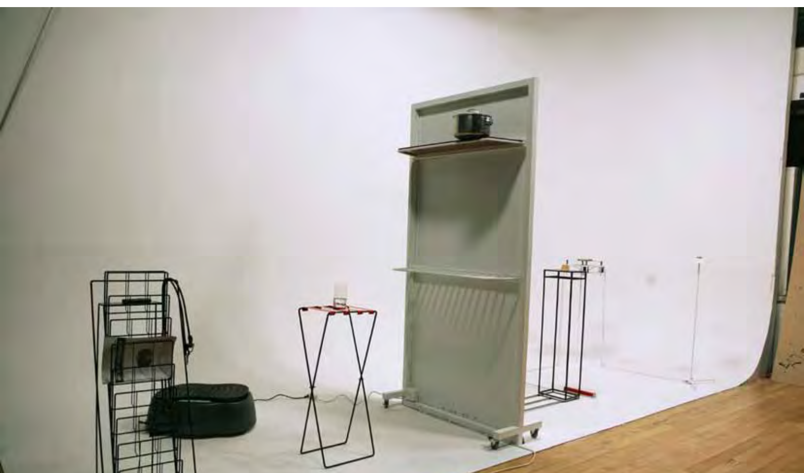
SERIES OF DOMESTIC EARTHQUAKES I / STOCKHOLM / 2010